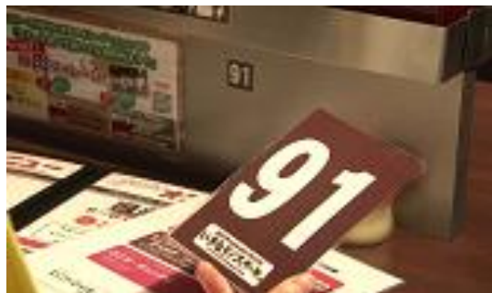
②テーブル番号札を持って