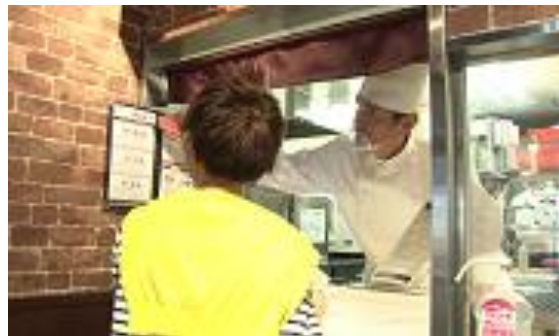
④お肉の種類と量をご注文