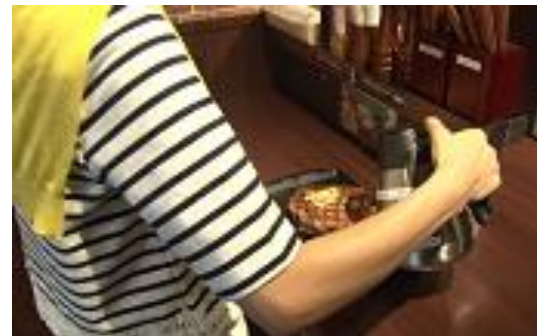
⑦ステーキが到着したら、 ステーキソースをよく振って