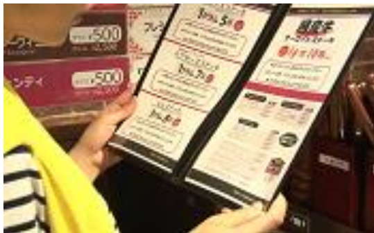
①お席についたら、ステーキ以外をご注文