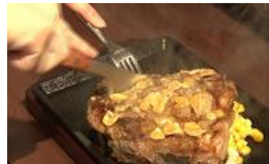
⑧バターを伸ばし、豪快にカットして いきなり！かぶりつけてください