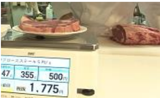
⑤その場で計って、料金も確認 好みの焼き加減で