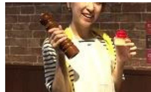
⑨ブラックペッパー、ガーリックペースト お好みで、美味しさアップ！