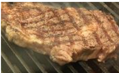
⑥すぐに、隣の焼き場で焼き始めます。