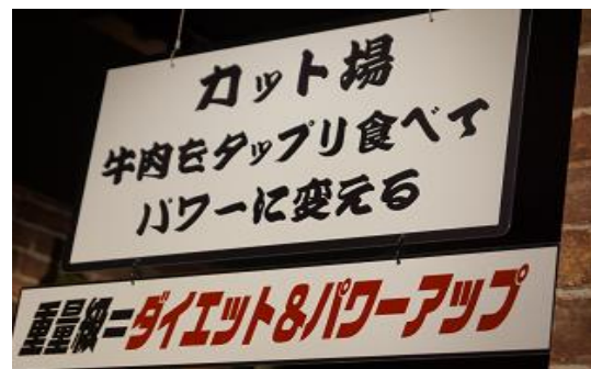
③キッチン前のカット場へ