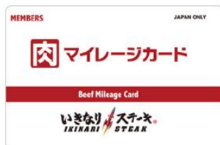
肉マイレージカード(スタンダード)

70歳以上を対象とした、肉マイレージカードです。肉マイレージのプラチナカードと同様の特典のほか、ドリンク無料や、敬老の日のプレゼント、行列時の優先的な入店(同伴者1名)、肉マネーチャージボーナスが常時3倍など、特別な特典を受けることができます。